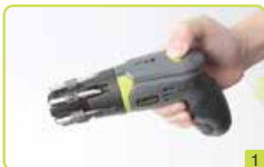
스crew 드라이버 뒷면에 "PRESS" 버튼을 눌러 줍니다. (사진 1 참조)