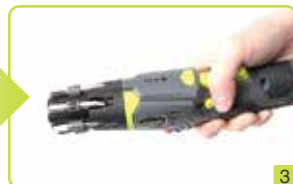
일자형 타입변경 (사진 3 참조)