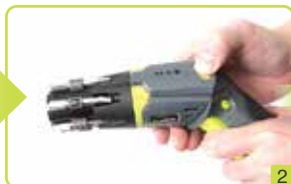
"PRESS" 버튼을 누른 상태에서 스crew 드라이버 손잡이 부분을 비틀어 줍니다. (사진 2 참조)